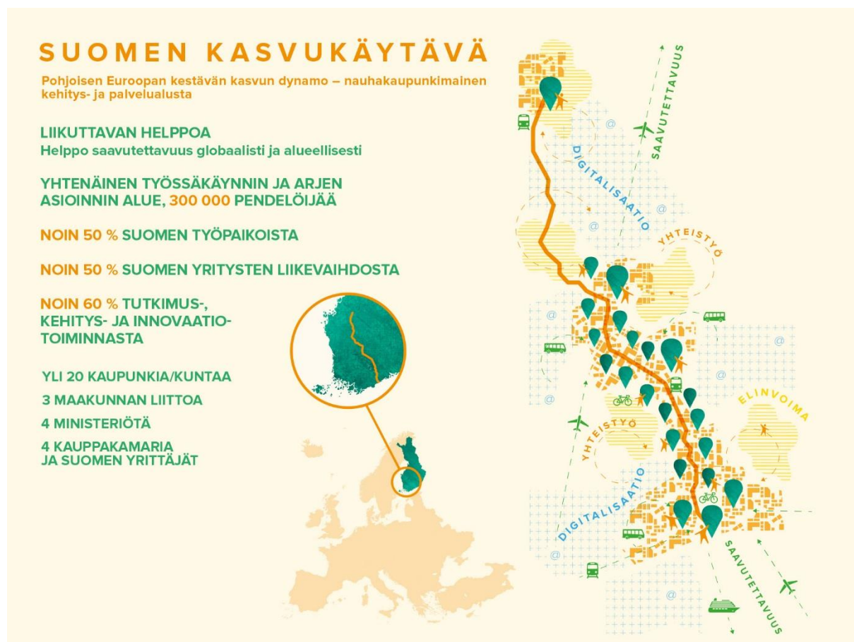
Kuva 1. Suomen kasvukäytävä on Suomen vahvin kasvukäytävä.

Jokainen kaupunki ja kunta sekä muut verkoston toimijat ovat aktiivisia toimijoita, jotka tekevät omasta alueestaan ja organisaatiostaan mahdollisimman vahvan ja houkuttelevan. Kullakin alueella on omat vahvuudet, haasteet ja kehittämistarpeet. Suomen kasvukäytävää kehitettäessä on erittäin tärkeä nähdä miten kunkin toimijan omat tavoitteet ja strategia linkittyvät yhdessä sovittuihin kasvukäytävän tavoitteisiin. Erityisen keskeistä on miettiä mitkä ovat sellaisia kehittämisteemoja, joissa kannattaa tehdä yhteistyötä useamman kasvukäytävän toimijan kesken. Yhdessä voimme vahvistaa sekä kunkin alueen että koko kasvukäytävän vetovoimaa. Voimme toimia koko Pohjoisen Euroopan kestävän kasvun edistäjinä tehden yhteistyötä alueellisesti, kansallisesti ja globaalisti.