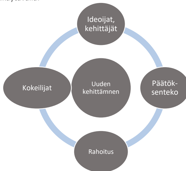
Kuva 2. Kehittäminen on ketterää ja jatkuvaa.

Uuden osaamisen synnyttäminen sekä osaamisen kehittäminen yhdessä koulutus- ja tutkimustoimijoiden sekä yritysten ja julkisten toimijoiden kanssa on tärkeää. Parhaimmillaan Suomen kasvukäytävä -verkoston osaavat ihmiset onnistuvat yhteistyössä, joka edistää kestävästä taloudellista, sosiaalista ja ekologisesti kasvua, uuden liiketoiminnan syntymistä sekä hyvinvoivaa ja sujuvaa arkea kasvukäytävällä.