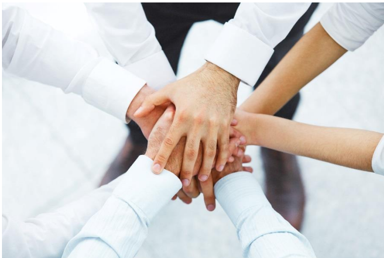
KUVA 1: Yhteistyöllä lisää elinvoimaa ja kestäväää kasvua.

Suomen kasvukäytävä -verkoston organisaatiot ovat aktiivisia toimijoita, jotka kehittävät aluettaan tai organisaatiotaan omien strategioidensa mukaisesti ja samalla edistetään myös yhdessä sovittuja tavoitteita. Aidosti organisoitunut verkostomainen yhteisö, jossa osaavat ja kehittämishaluiset ihmiset haluavat tehdä vaikuttavaa yhteistyötä on yhteistyön menestymisen edellytys. Verkoston sosiaalinen pääoma ja yhteistyössä tarvittava luottamus sekä erilaisten näkökulmien ymmärtäminen kasvavat yhdessä tehden. On tärkeää oppia tuntemaan verkoston toimijoiden vahvuudet sekä ymmärtämään kunkin toimijan tavoitteet. Muuttuvassa maailmassa tarvitaan kykyä tarttua nopeastikin uusiin mahdollisuuksiin: vahvalla osaajien verkostolla löydetään nopeasti oikeat ihmiset edistämään tärkeäksi koettuja asioita. Ihmisten väliset toimivat yhteistyösuhteet ja luottamus helpottavat vaikuttavien kehittämistoimien käynnistämistä sekä laadukasta toteuttamista. Yhteistyöllä voimme ratkaista haasteita ja rakentaa uutta kestäväää kasvua kansallisesti ja kansainvälisesti.